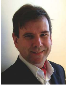
蒂埃里·拉方特 (Thierry Lafont)